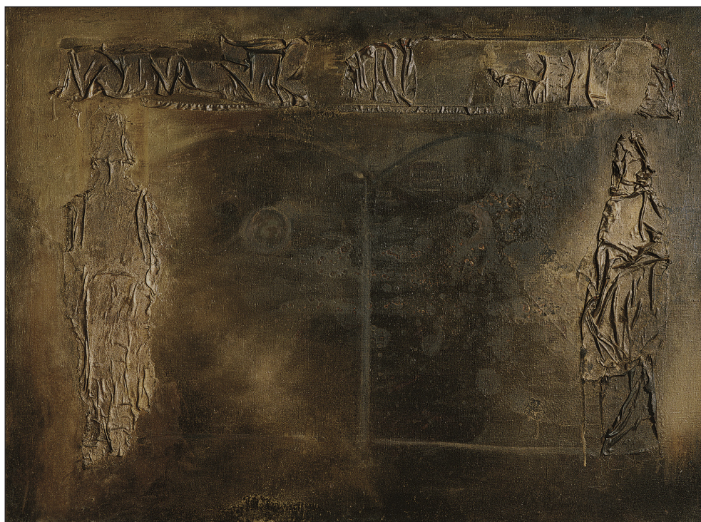
Mihail Grecu. Poarta strămoșilor . 1977, pânză, tehnică mixtă, 104 × 140 cm. Galeria de Stat „Tretiakov”, Moscova

Volumul Anatol Codrul. Mitul personal se anunță un important punct de reper pentru reconstituirea bogatei biografiei de creație a poetului-cineast, dar și pentru conturarea într-o efigie critică a fenomenului șaizecist și a întregului proces literar-artistic din perioada postbelică.